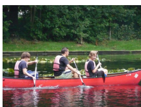
Kick op sport 3de jaar