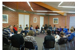
beziningsdagen 5de jaar