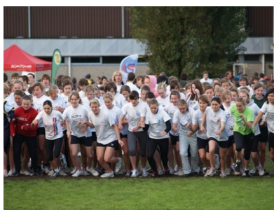
Start van de Don Bosco cross in 2010-2011

Volgende leerlingen slaagden daar wonderwel in: