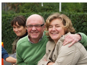
Vriendschapsdag 1ste jaar