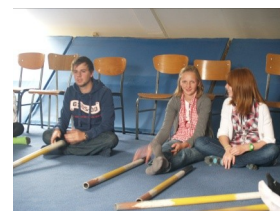
Mondiale dag 2de jaar