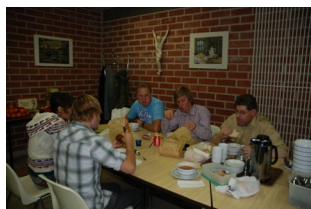
beziningsdagen 4de jaar