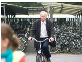
Fietsproef 1ste jaar

Eind september, begin oktober zijn er traditioneel de bezinningsdagen en studiereizen. Hieronder leraren aan de slag.