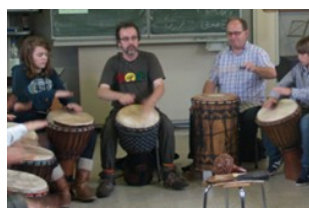
Mondiale dag 2de jaar